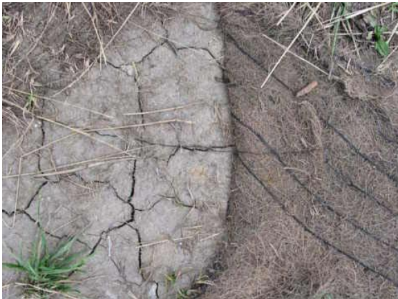
Tierra bien compactada que nunca va a soportar raíces suficientes para mantener arboles saludables.