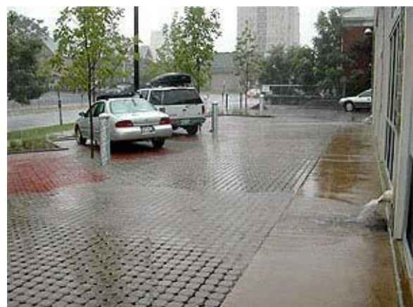
Pavimento permeable aumenta la cantidad de tierra de minerales disponible en un sitio muy desarrollada.