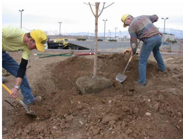
La temporada mejor para plantar árboles es durante noviembre y febrero.