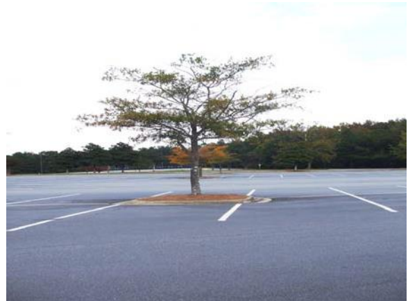
La falta de área superficial libre causa este árbol no crecer a una altura normal.